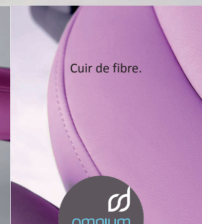
Cuir de fibre.