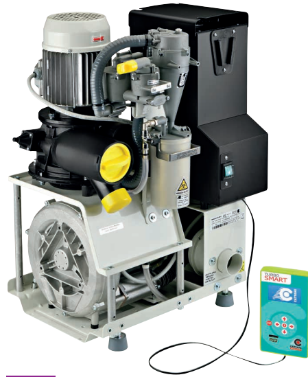
TURBO-SMART A CATTANI