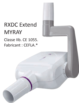
RXDC Extend MYRAY Classe IIb. CE 1055. Fabricant : CEFLA.*

ÉQUIPEZ VOTRE 2 ÈME CABINET À PARTIR DE 296 €/MOIS SUR 7 ANS**