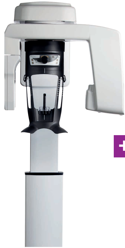
CS8100 2D CARESTREAM DENTAL Classe IIb. Fabricant : Carestream Dental LLC.*