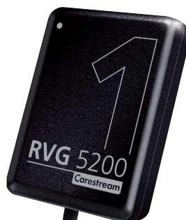
RVG 5200 CARESTREAM DENTAL Classe IIa (BSI). Fabricant : Carestream Dental LLC.*