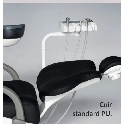
Cuir standard PU.